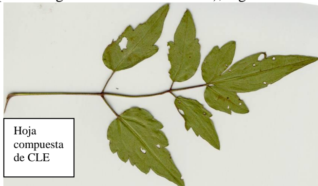
Hoja compuesta de CLE

Observando la planta entera enseguida nos damos cuenta de dos fases diferenciadas en su crecimiento. Desde su nacimiento crece y crece con fuerza hacia todas direcciones, creando estolones, es decir, en cada cierta porción de tallo en contacto con la tierra, se desarrollan nuevas raíces y esta característica dificulta su erradicación en los campos de cultivo o huertos en los que haya penetrado la especie. Pero cuando en su camino de crecimiento encuentra algún obstáculo, bien sea una pared, un árbol o una roca, trepa buscando la luz, escapando de la gravedad. Y aún después de trepar varios metros (puede llegar a los 20 m de altura), sigue creciendo, descolgándose, para que aquello