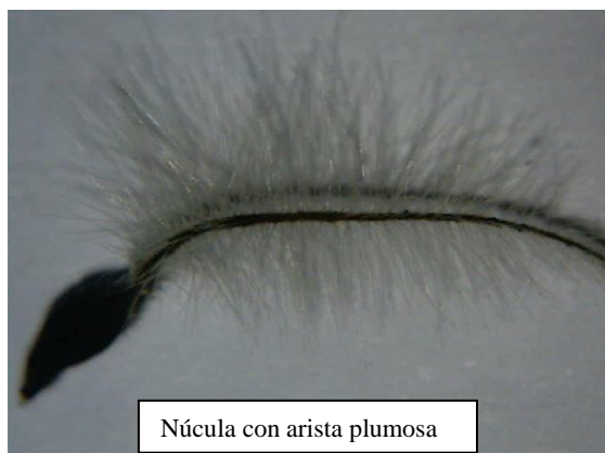
Núcula con arista plumosa

Estas dos fases de crecimiento rebelan el sentido de su don: la capacidad de despertar a los adormecidos en demasía y ayudarlos a enraizar. Permitir aterrizar a los que vuelan en exceso y no encuentran un interés en el presente. Tanto para los que se proyectan demasiado en el futuro, como los que se evaden durmiendo para no tocar la realidad material.